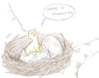
這幅畫的主人是一位來自紐約華人移民家庭的7歲小女孩

畫面中，剛剛破殼的小鳥孤零零待在鳥巢裏，大聲地呼喚鳥媽媽。周圍的小朋友猜測這個小鳥可能很想媽媽、很傷心，畫了這幅畫小朋友卻兩手一叉腰，說，「不，它很生氣！」