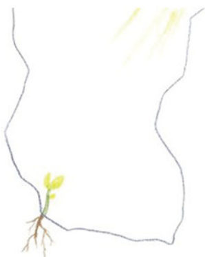
創傷的男孩畫了一粒堅強的種子

還有一個曾經遭遇重大創傷的高中男生，他在畫作中講述了一粒種子掉進深不見光的大坑裏的故事。被漆黑寒冷包圍著的種子，憑著一絲光亮、一點雨水，努力紮根在最深的地方，最終長成了森林裏最高最健壯的參天大樹。通過故事中一個充滿希望和力量的轉折，他完成了從「受害者」到「生還者」的轉變，既接受了創傷這一事實，又樹立了改變和重建的意念。