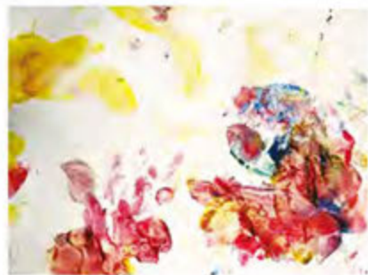
小豆第一次自由塗鴉