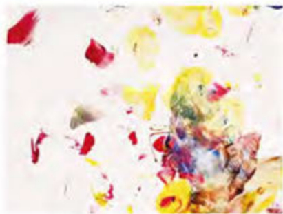
小豆第一次自由塗鴉